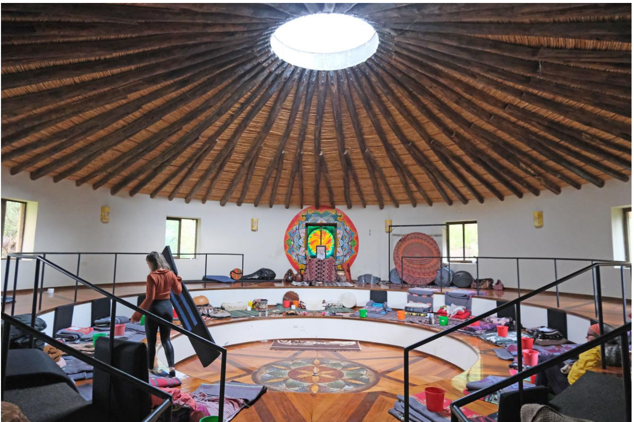
Maha-templet før ceremonien starter.

Deltagelse i ceremonien betales kontant før start. Pris 400 soles.