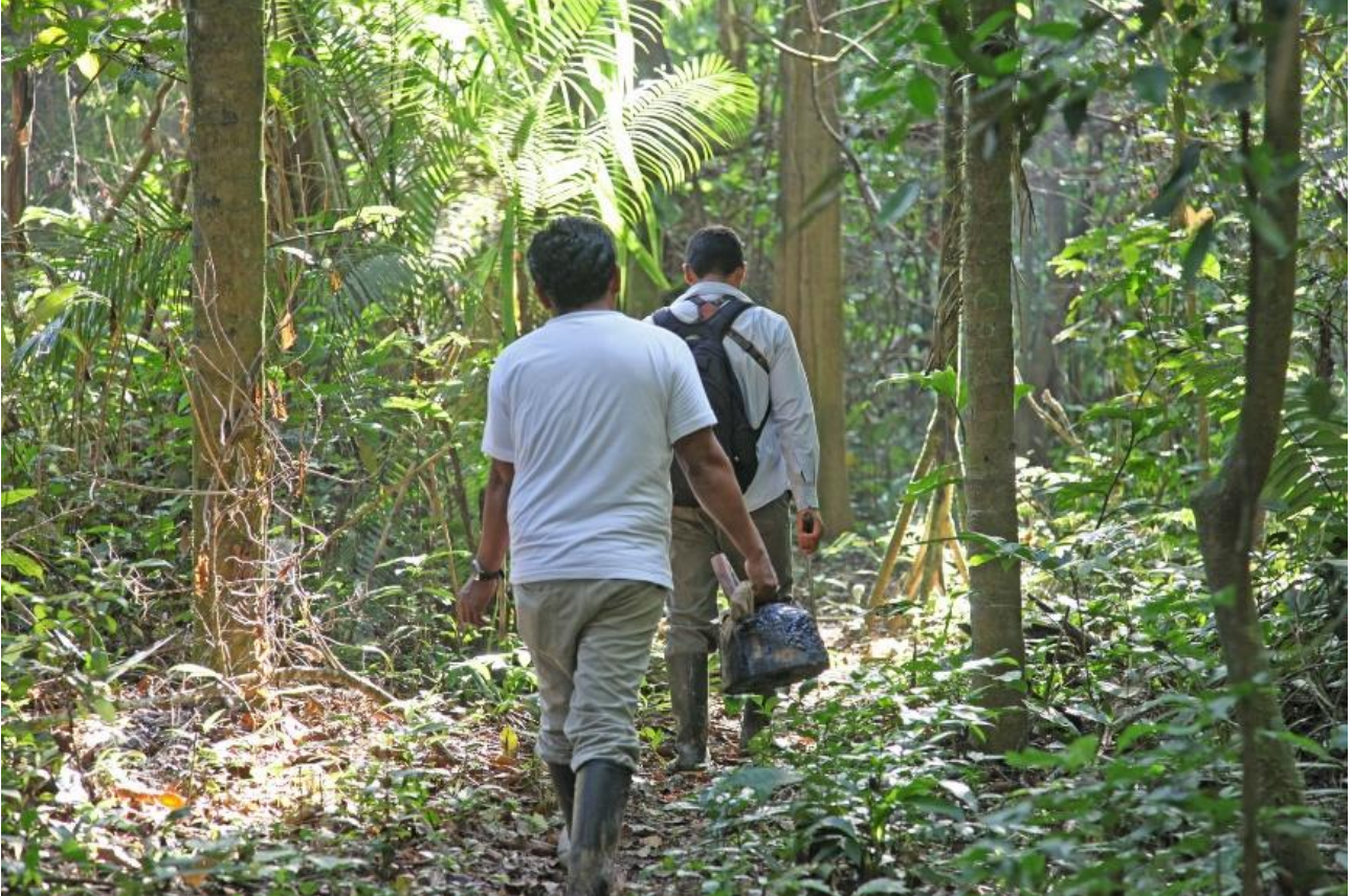
Vandring i Amazonas.