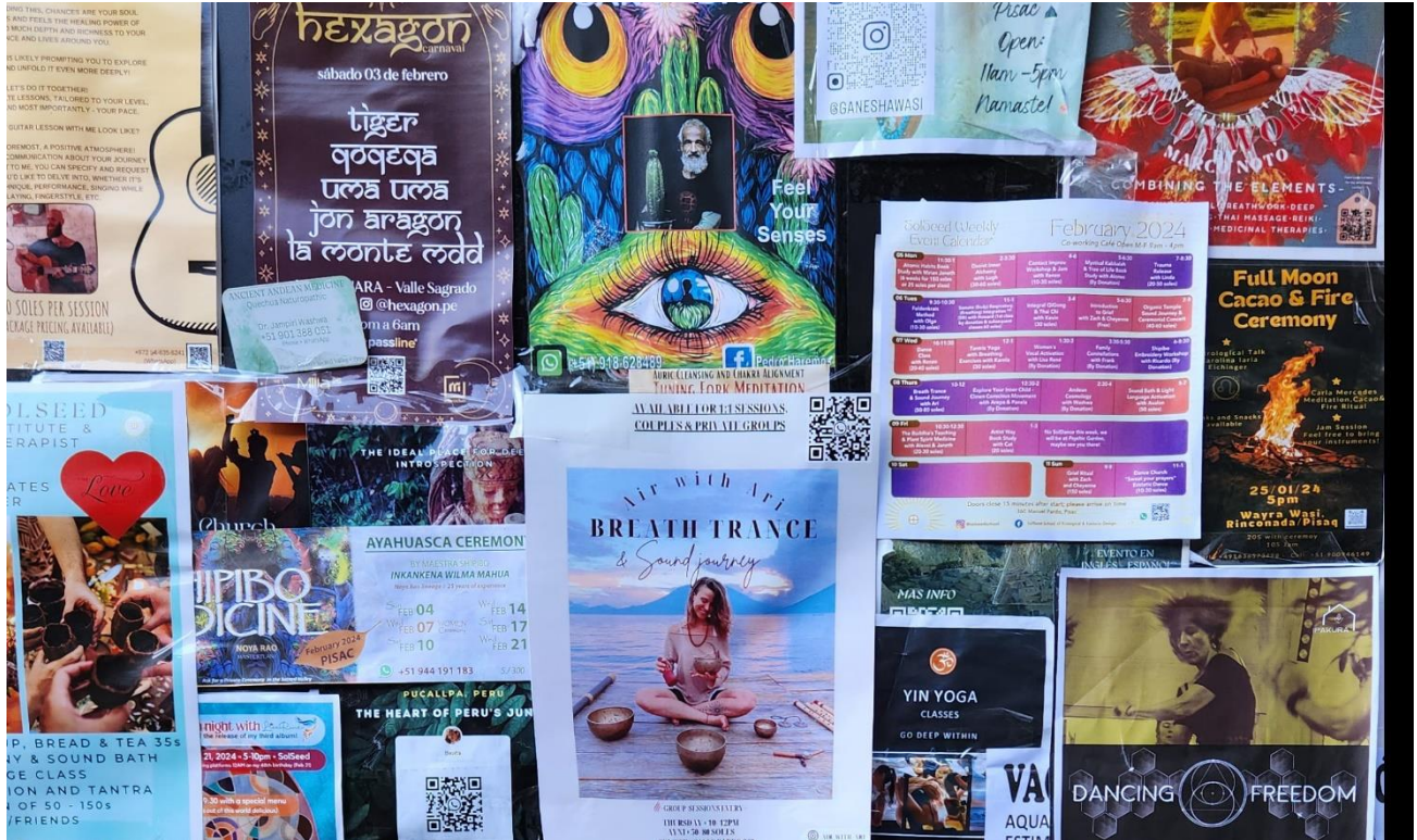
Udsnit af opslag på en dør i Pisac.

Pisac er centrum for spirituelle aktiviteter, og mange tilrejsende slår sig ned i længere tid for at deltage i retræter og ceremonier. Et kig på opslagene rundt i byen viser, at facilitatorer inviterer til blandt andet breath work, cacaoceremoni, yin yoga, fri dans, kvindecirkel, trommeregjæ, kurser i plantemedicin, energihealing samt psykedeliske rejser med San Pedro og ayahuasca.