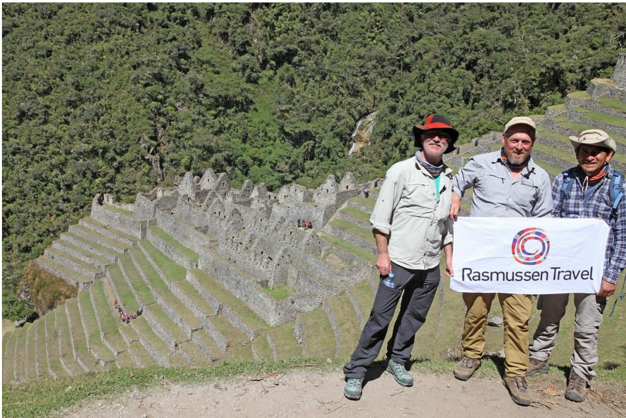
Under turen kommer man tæt forbi inkaruinen Wiñay Wayna.