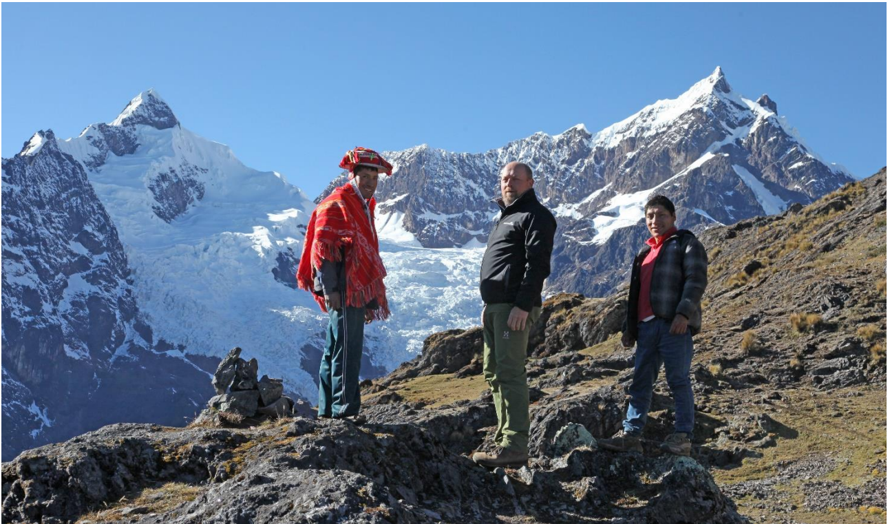
Ved bjerget Cancha Cancha.

I bliver hentet på jeres hotel om morgenen og kører op til startstedet ved bebyggelsen Quishuarani i den nordlige del af Lares. I stille tempo vandrer I op gennem dalene og kommer til et højland med fantastisk udsigt. I vandrer frem mellem de to snedækkede bjerge Chicón og Cancha Cancha. Senere vandrer I nedad og når dalen ved bebyggelsen Cancha Cancha, hvor I slår lejr.