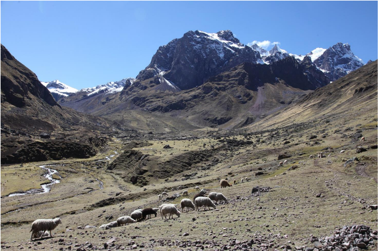
Landskabet på dag to.

Efter vandreturen bliver I kørt til jeres hotel.