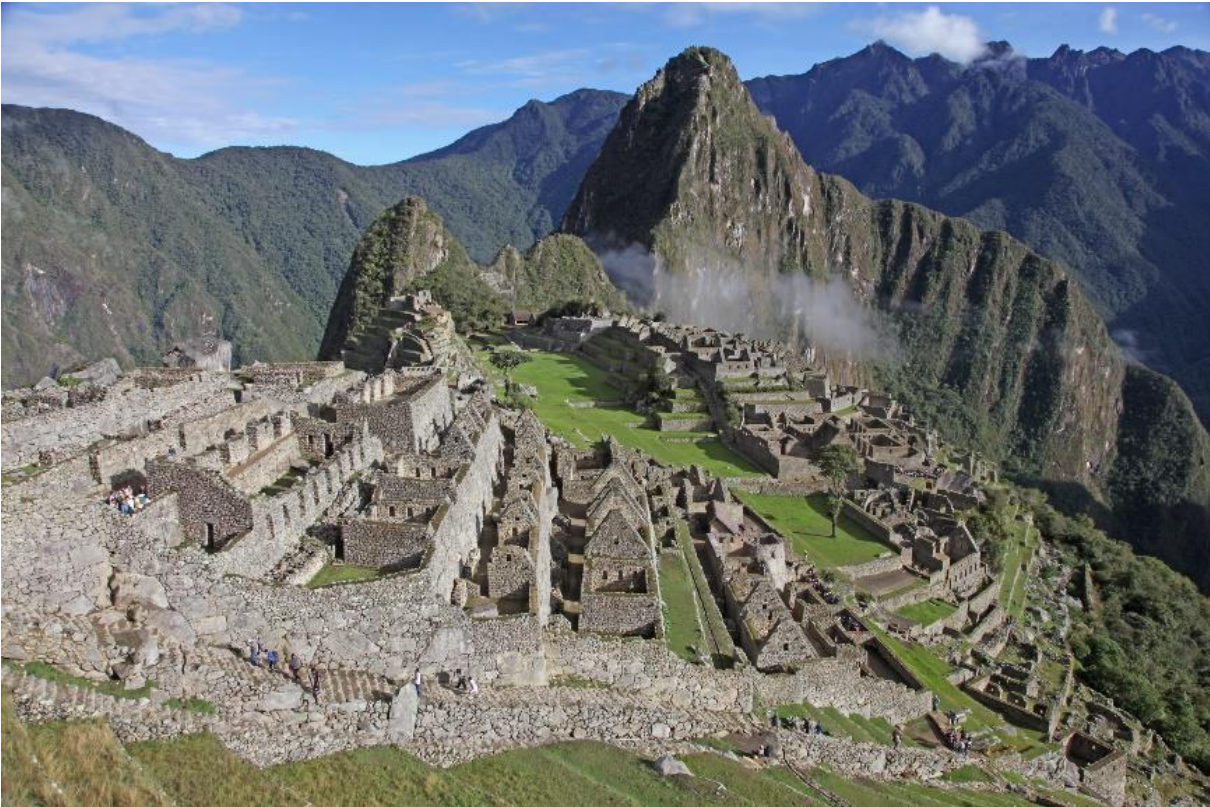
Bag Machu Picchu rejser bjerget Huayna Picchu sig.

Jeres guider fører jer rundt på Machu Picchu, og fortæller historien om inkaernes hellige by.