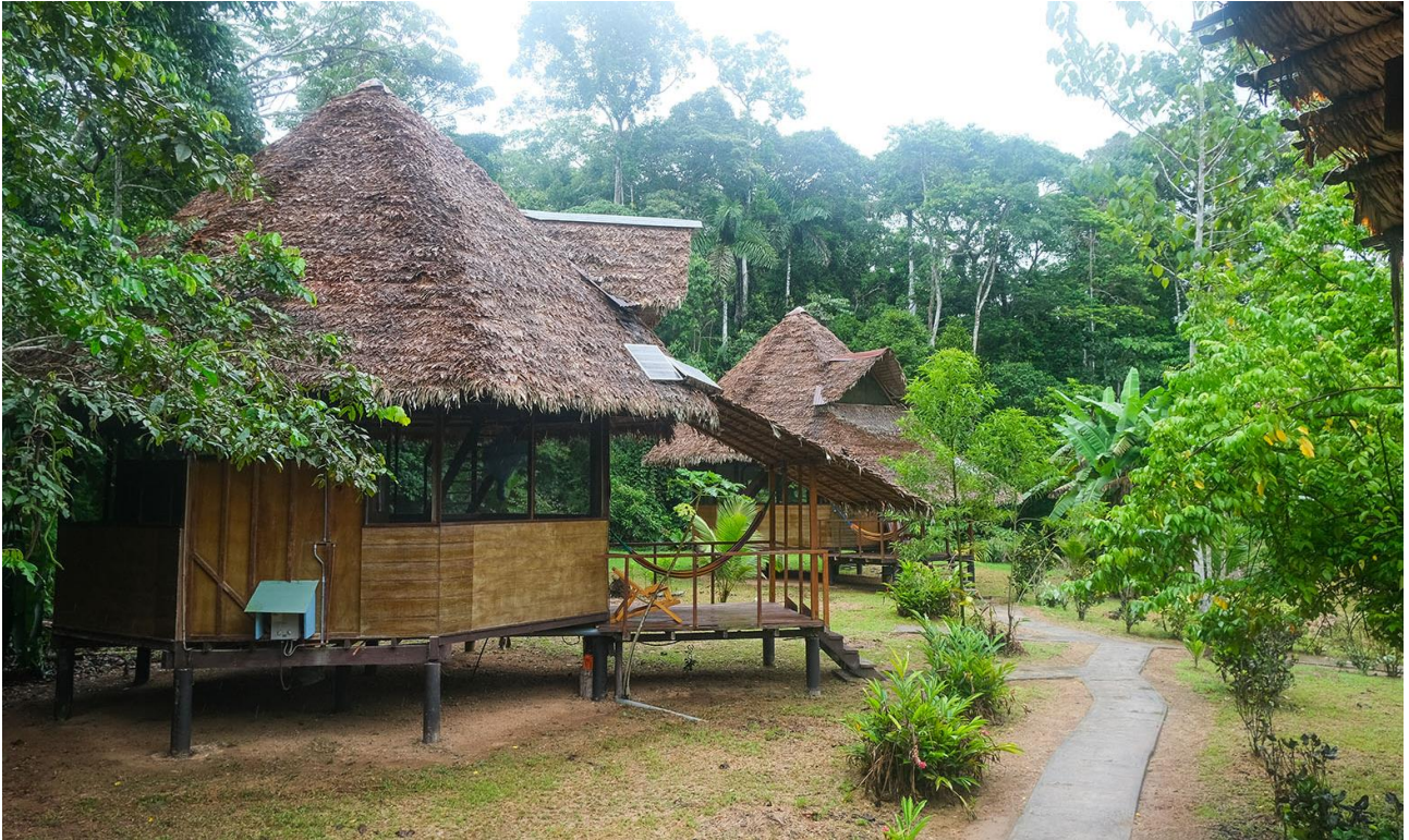
Monte Amazonico Lodge Tambopata ligger ud til floden Río Tambopata.

Et ophold på lodgen Monte Amazonico Lodge Tambopata giver et fint indtryk af junglen i det sydlige Peru. Lodgen grænser op til den store park Reserva Nacional Tambopata, hvor dyre-, fugle, og plantelivet er beskyttet og intakt.