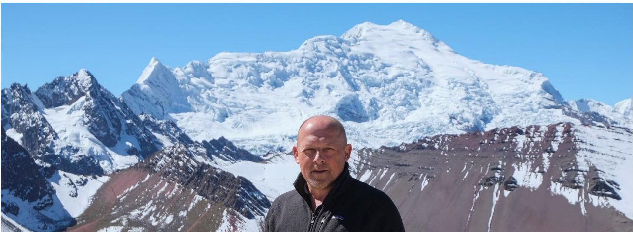
Fra Regnbuebjerget er udsigt til Ausangate, det største bjerg i det sydlige Peru.