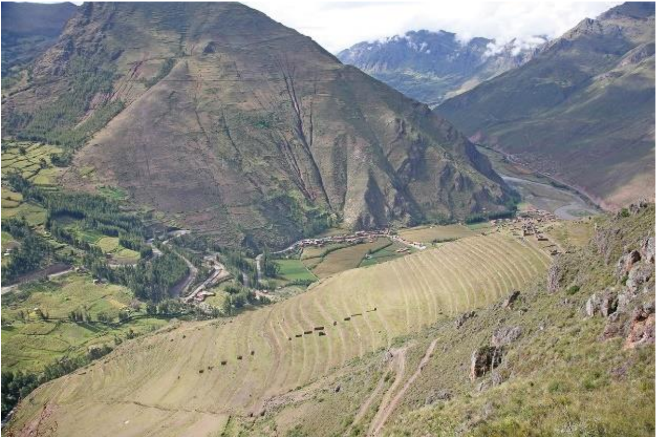
Omfattende terrasser ved det arkæologiske kompleks over Pisac.

Jeres billet BTI giver adgang til de arkæologiske komplekser i Pisac.