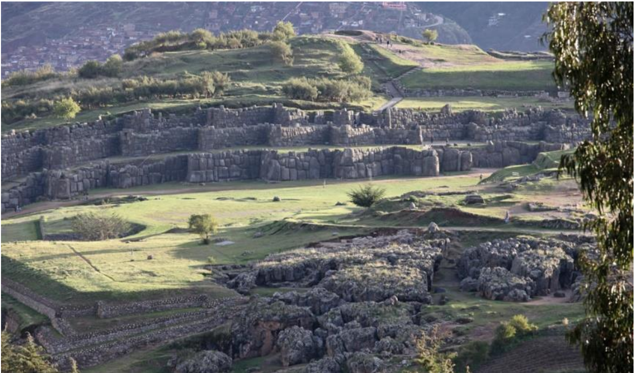
Sacsayhuamán ligger ovenfor Cusco, en god halv times gang fra Plaza de Armas.

Omkring Cusco er det: Sacsayhuaman, Q'enqo, Puka Pukara, Tambomachay, ruiner ved Pisac, ruiner ved Ollantaytambo, historisk bykerne i Chinchero, terrasserne Moray, terrasserne Tipon og Piquillacta.