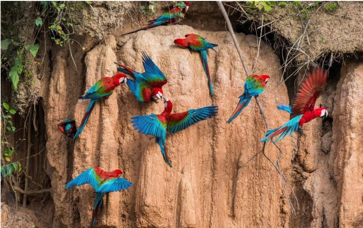
Monte Amazonico Lodge ligger nær en stor "papegøjeskrænt".