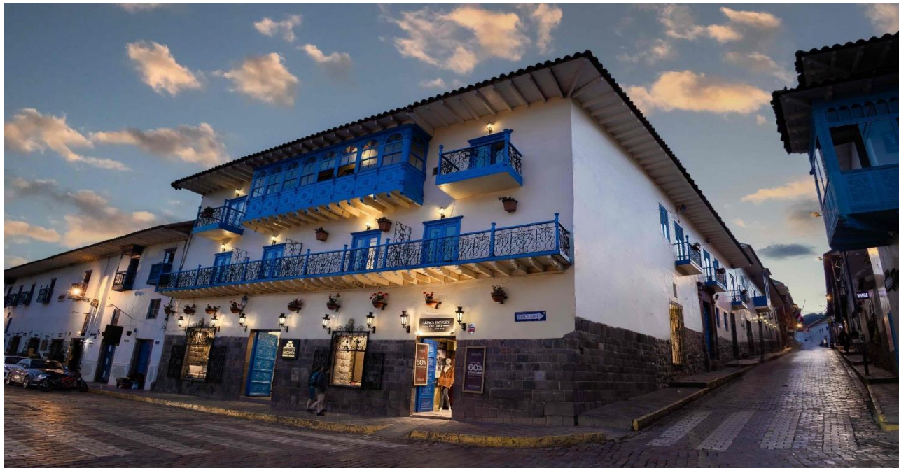
Hotellet ligger ud til den lille Plaza Regocijo.

Eller lignende hotel i samme prisklasse.