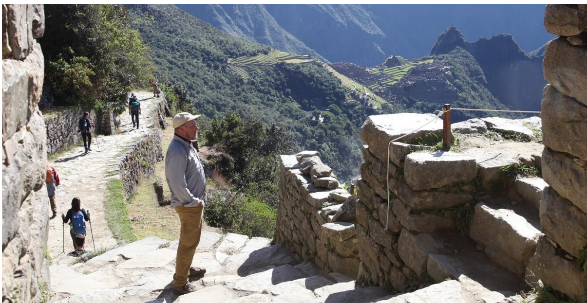
Machu Picchu set fra Solporten.