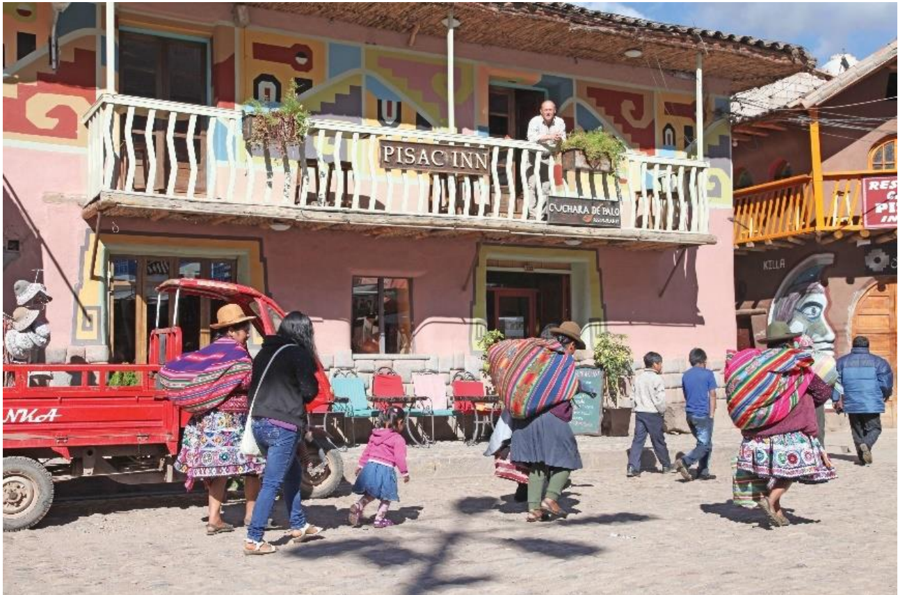
Hotel Pisac Inn.

Rasmus bliver kørt til centret med ayahuascaceremoni.