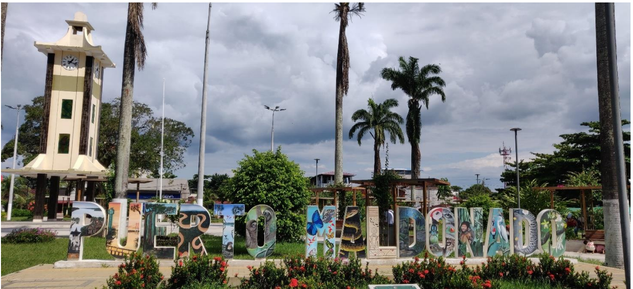
Plazaen i Puerto Maldonado.

Når I kommer ud af lufthavnsbygningen, bliver I modtaget af en person, der bærer et skilt med jeres navn. I bliver kørt ind til lodgens kontor i centrum af Puerto Maldonado. Her kan I lade de ting stå, som I ikke har brug for i junglen.