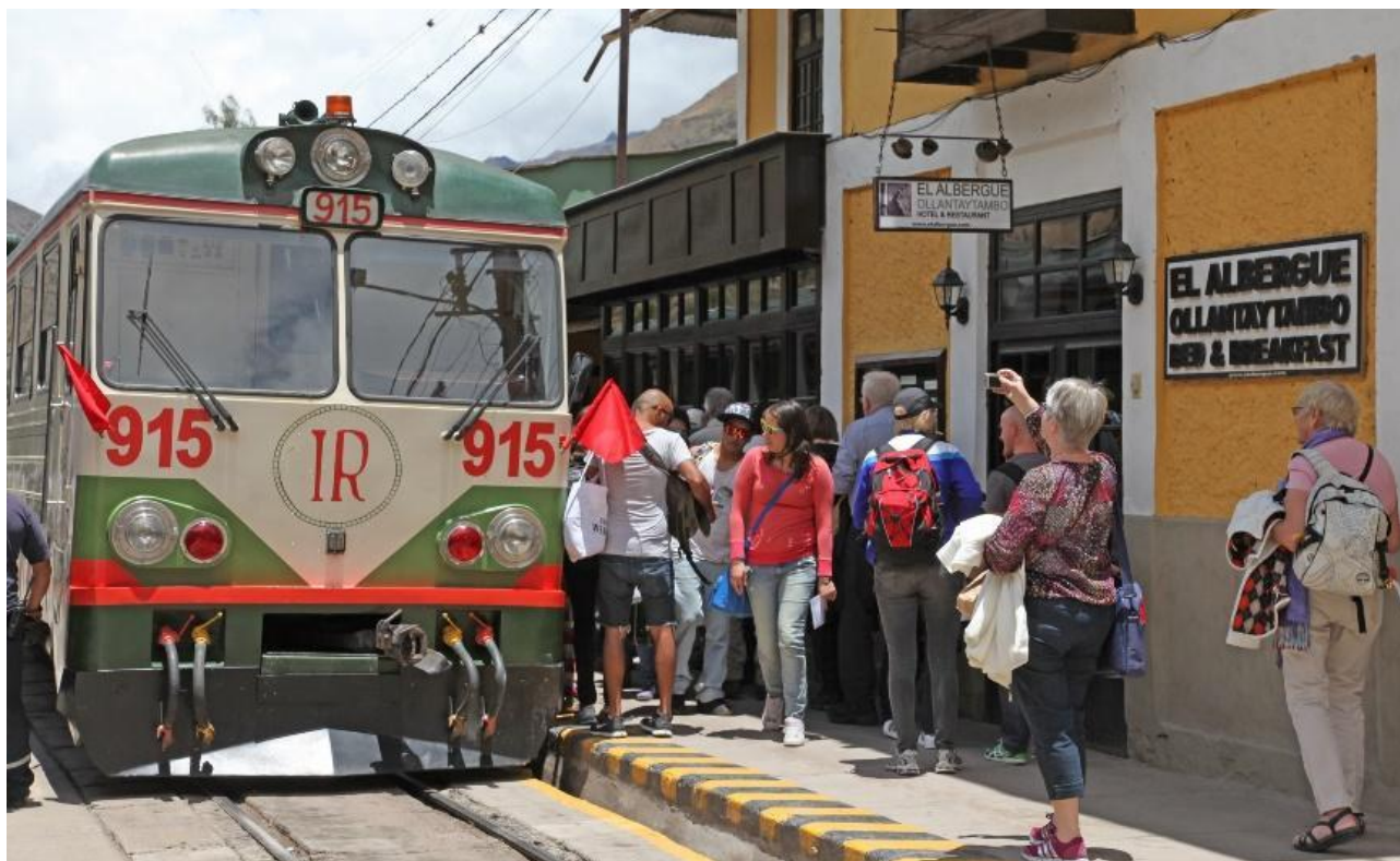
Toget afgår fra den lille station i Ollantaytambo.