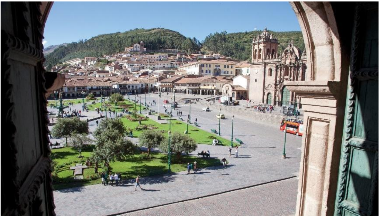
Plaza de Armas i Cusco.