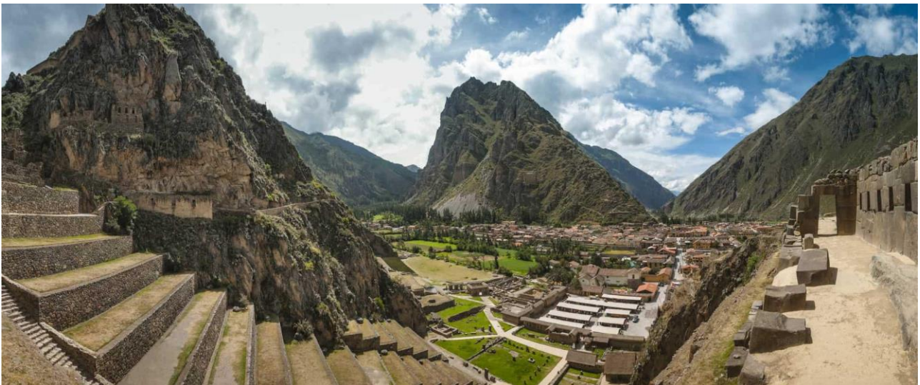
Det arkæologiske kompleks i Ollantaytambo.

Ollantaytambo har i høj grad sit gamle særpræg i behold, idet byplanen er intakt fra inkatiden. Husene blev bygget omkring en gård, hvorfra der kun var én udgang til gaden. Man får et godt indtryk ved at gå rundt i de smalle gader ovenfor plazaen, der hyggelig med mange caféer og spisesteder. Umiddelbart bag Ollantaytambo rejser terrasser med høje mure sig op ad bjergsiden. På toppen ligger et af inkaernes forsvarsværker med tilhørende tempel. Det nåede aldrig at blive bygget færdig, hvilket giver den besøgende mulighed for at se, hvordan man fik transporteret de store sten på plads.