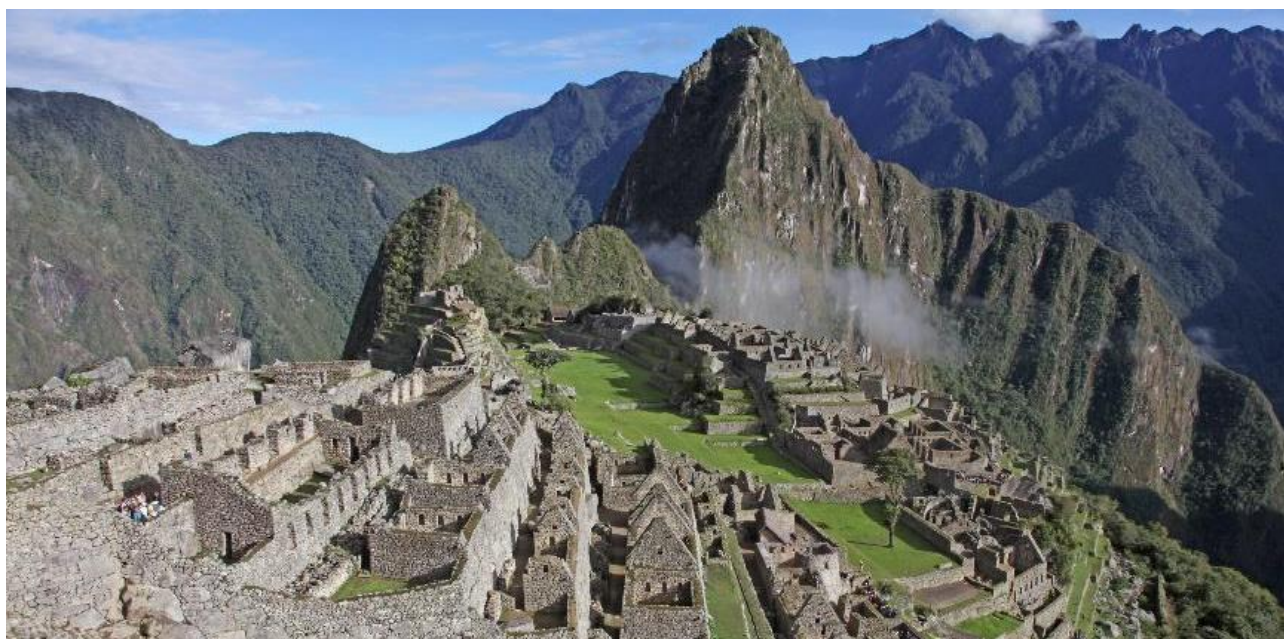
Inkabyen Machu Picchu.