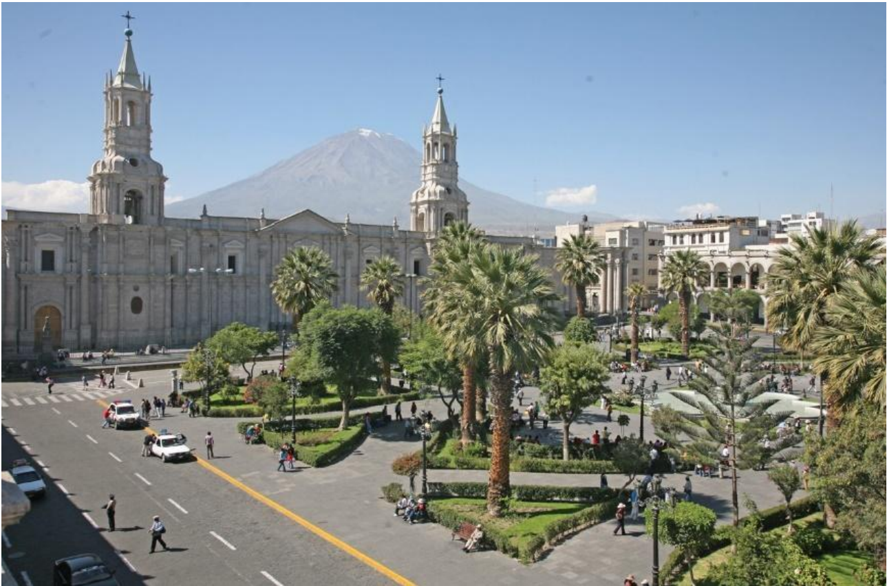
Plaza de Armas med katedralen i Arequipa.