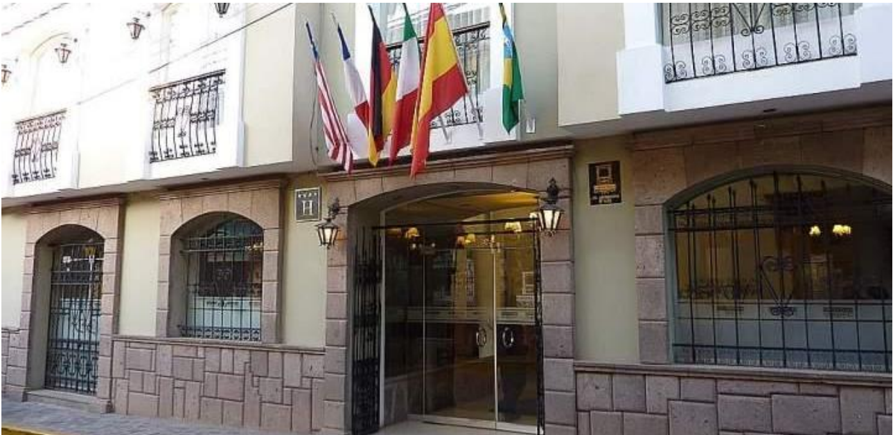
Indgangen til hotellet.