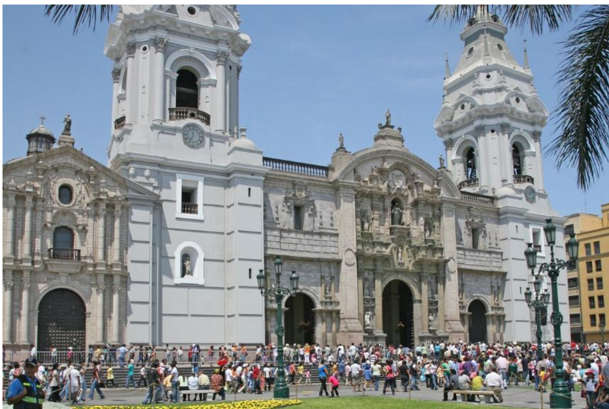
Katedralen i den historiske bydel.