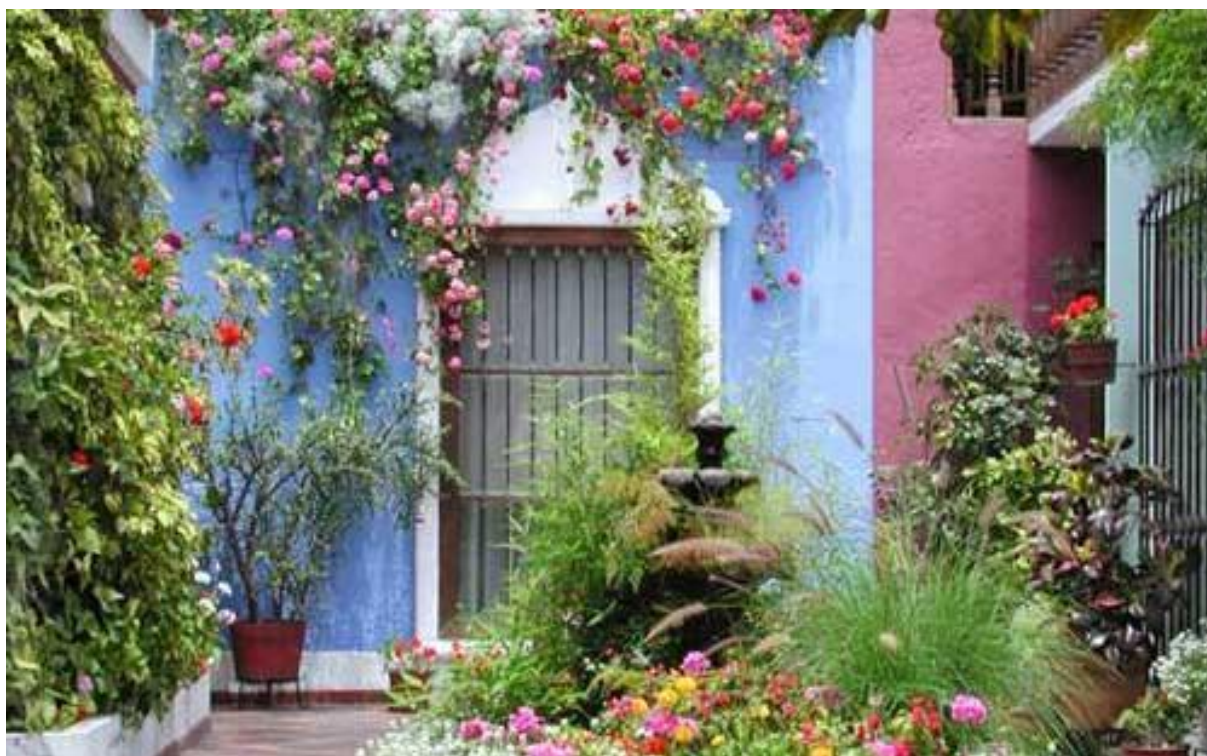
Indergården – patioen – på Hostal El Patio.

Eller tilsvarende hotel I samme kategori.