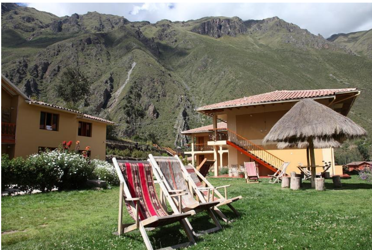
Mellem hotellets bygninger er grønne arealer.

Eller tilsvarende hotel i samme kategori.