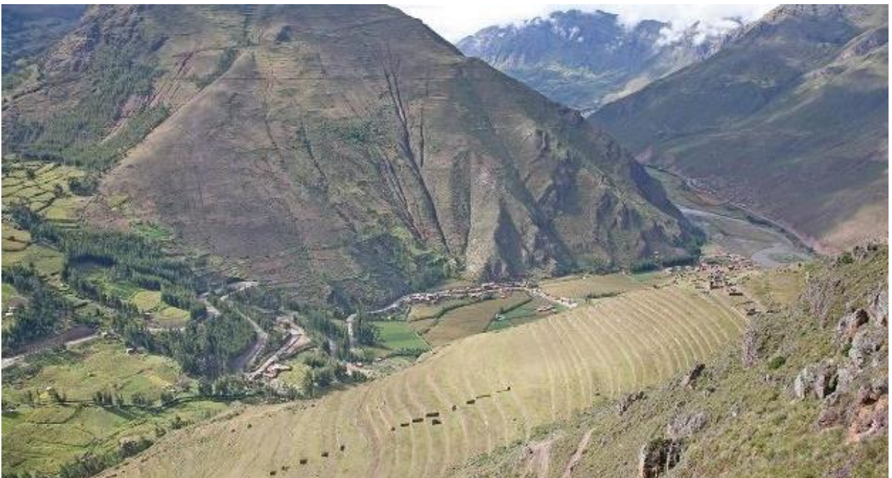
Omfattende terrasser ved det arkæologiske kompleks over Pisac.

På vej tilbage mod Cusco stopper I ved et udsigtspunkt med et storslået udsyn ned gennem Inkaernes Hellige Dal. Sidst på eftermiddagen ankommer I til Cusco.