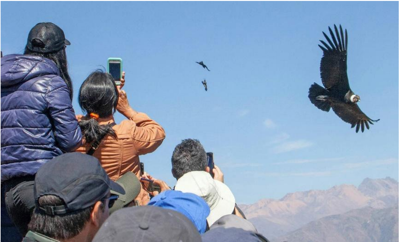
Kondor ved Cruz del Condor.

I kører op til udsigtspunktet Cruz del Condor. Her er om formiddagen store muligheder for at opleve kondoren svæve tæt forbi.