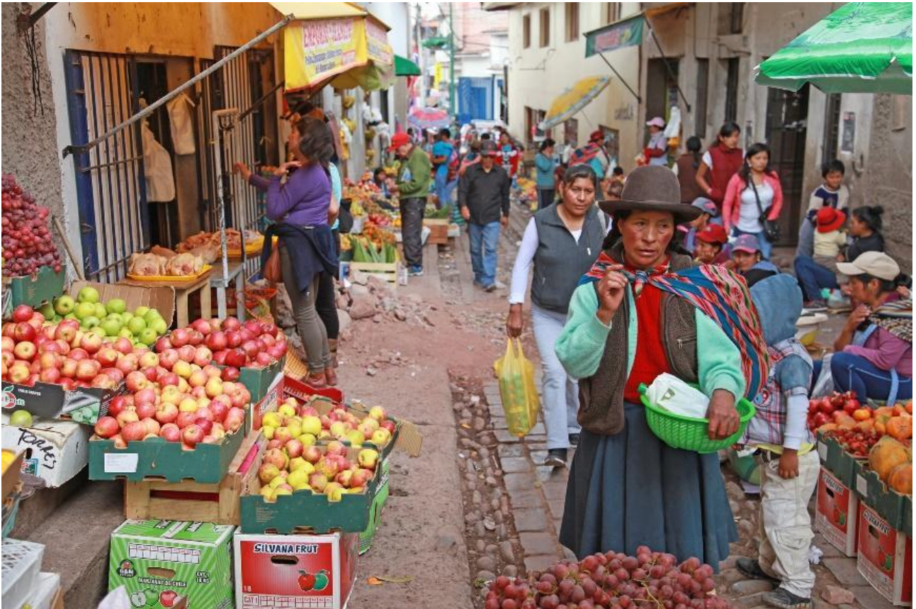
Markedsgade i området ved San Pedro.