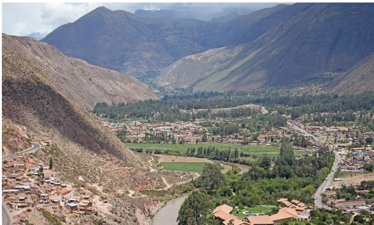
På vej mod Ollantaytambo. Her er nedkørslen til Inkaernes Hellige Dal.