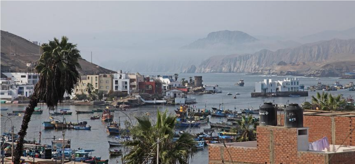
Bugten ved Pucusana.