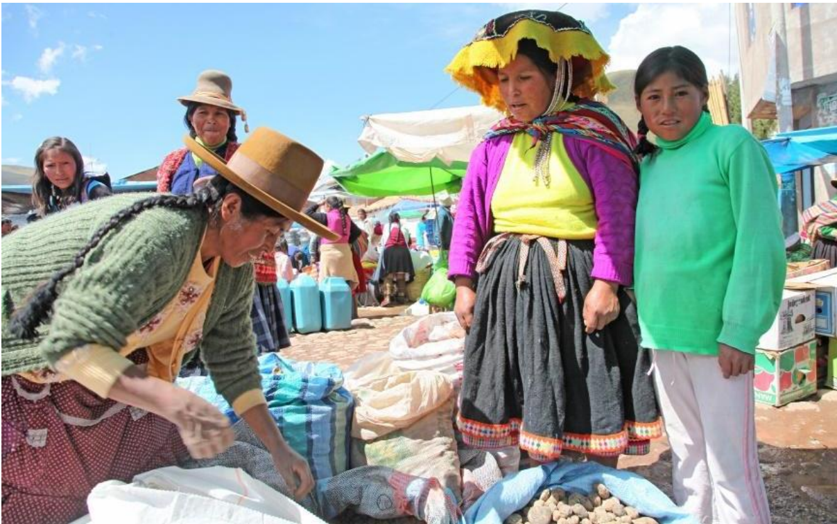
Kartoffelsælger på søndagsmarkedet i Combapata.

Markedet i Combapata ligger uden for den gængse rute for turister i Peru, og vi har endnu ikke mødt andre udlændinge på markedet! Det er her, indianerne kommer her for at handle til næste uges måltider og fornødenheder i husholdningen. Det er her, de sælger deres marsvin og tyre, og det er her, de køber nye senge og gryder. Det er her, de bliver klippet og det er her, de deler en øl med vennerne fra nabolandsbyen. Mange af kvinderne er traditionelt klædt i farvestrålende tøj og med lange sorte fletninger. Kvinderne bærer de små børn på ryggen, og de større børn går nysgerrigt rundt og kigger med, når forældrene handler. Fordi det stadig er sjældent, at turister kommer forbi markedet, kan du gå her og kigge på det store udbud i ro og mag uden at blive antastet af pågående sælgere.